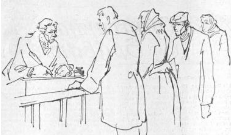
„Erst Listen anfertigen“. Zeichnungen: Erich Behrendt

kam, du hier, du da. Und man sagte ihnen rundheraus, dass sie darin wohl gar noch überwintern müssten.