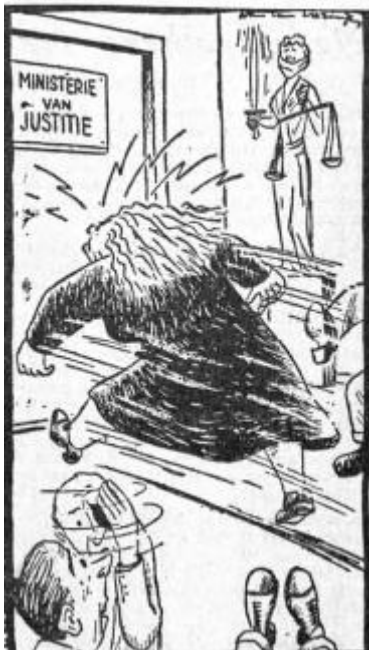
(„Het Vrije Volk“, Amsterdam) Die „Rote Hilde“ Geht in Ostberlin in Front

kp. Von einer „Verhärtung des Sowjetkurses“ sprechen heute sogar jene vielen Auslandskommentatoren, die in den zurückliegenden Wochen und Monaten nicht müde wurden, eine angeblich weitgehende Versöhnungsbereitschaft festzustellen. Die neue Welle politischer Verfolgungen mit Racheaktionen nicht nur in der Sowjetzone, sondern auch in Ungarn, der Tschechoslowakei und anderen Gebieten mit sowjetischem Trabantenregime lässt sich einfach nicht übersehen. Die Ernennung etwa des grobschlächtigen Moskauer Sabotagespezialisten Wollweber zum einstweiligen Nachfolger des „roten Himmler“ Wilhelm Zaisser und der „bolschewistischen Furie“ Hilde Benjamin zum Justizminister von Kremls Gnaden spricht für sich. Wo noch Zweifel bestanden haben sollten, da hat die rote Hilde mit ihrem Schrei nach erbarmungsloser Vergeltung und Vernichtung aller irgendwie nicht Genehmen den Kommentar geliefert. Die Tonart, die die „Prawda“ am 23. Juli zur vorgeschlagenen Außenministerkonferenz anschlug — freie Wahlen und Bildung einer echten gesamtdeutschen Regierung vor einem „Friedensschluss“ nach Moskaus Geschmack wurden brüsk abgelehnt — dürfte im Westen manchen aufgeschreckt haben, der sich Wunderdinge von einem Gesinnungswandel des Kreml erhoffte. Der Hochkommissar der Sowjets in Karlshorst, Semjonow , den man noch vor kurzem in Paris und gelegentlich in London als „Mann der milden Töne“ abstempeln wollte, bewies in seinem Protest an Conant und die USA, dass er die echte Moskauer Melodie wohl beherrscht.