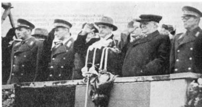
Die „Generalität“ der Sowjetzone (von links nach rechts): Heinz Hoffmann , Leiter der Abteilung kasernierte Volkspolizei im Innenministerium, Heinz Kessler , einst FDJ-Führer und jetzt General der „Nationalen Streitkräfte“ (Luft), Schwernik , der zu Besuch aus Moskau kam, Pieck und Vincenz Müller , General des Heeres und heute Vopogeneral.