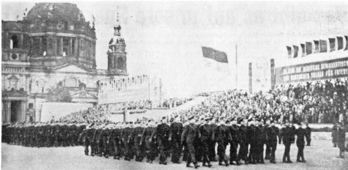
Vorbeimarsch der neuen Einheiten, welche die sowjetische „Nationalarmee“ bilden werden. Wie die Organisation, so ist auch die neue Uniform ein Abklatsch Moskauer Vorbilder.

Eine wichtige Rolle spielte bei all diesen Erörterungen auch das Klima. Selbst im strengsten Winter brauche der Sowjetsoldat nur seinen Watteanzug; der europäische Soldat aber friere. Westliche Armeen seien allein schon aus diesem Grund wenig beweglich.