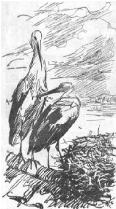
Ein Storch stand kerzengerade auf dem Dach, während der andere ihm von seinem Rumpf eine Feder nach der andern zupfte und sorgsam ins Nest legte. Zeichnungen: Wilhelm Eigener.

Zwischen drei und vier Uhr nachmittags kehrte ein Storch von der Nahrungssuche zurück. Es sah so aus, als wenn der auf dem Nest sitzende Storch gefüttert wurde. Es war kalt. Wie gingen alle fort; ich ging in ein Bauernhaus, um mich aufzuwärmen.