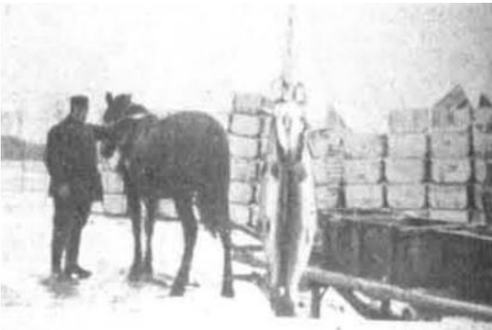
Der Fang war oft recht groß; unsere Aufnahme zeigt neben den gefüllten Fischkästen auch noch zwei Hechte, einen von 28 und einen von 22 Pfund. Das Bild wurde im Februar 1938 auf dem Dargainen-See gemacht

Ein Fischreiher zieht hoch mit gemächlichen Flügelschlägen vorüber. Heiser klingt sein Ruf. Die Fischer meinen, weil ihm ein Barsch beim Herunterschlucken die Kehle wundgekratzt hat. Inzwischen scheint er es sich anders überlegt zu haben; er wendet und, seine muldenförmigen Flügel leicht anziehend, kommt er schneller und schneller herunter und steht nun als neuer, höchster Gast am Eisrand. Wenn die großen Säger später tieftauchend fischen werden, und ein Schwarm von Fischen dann versuchen wird, vor ihnen ebenso wie vor dem zustoßenden Hecht ganz an die Wasseroberfläche zu entfliehen, vielleicht wird es ihnen dann gelingen, einen Fisch mit seinem blitzschnellen Schnabel zu packen und herauszuholen. Fischer müssen Geduld haben und warten können und trotzdem hellwach bleiben bei gespanntester Aufmerksamkeit — darin ist er Meister.