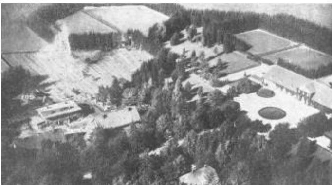
Aufnahme: Plan und Karte Das Gestüt Trakehnen aus der Vogelschau Man erkennt Wirtschaftsgebäude, sauber gehaltene Wege und freundliche Anlagen

Eine im größten Stil angelegte und ausgebaute Zuchtstätte inmitten der herb-schönen ostpreußischen Landschaft mit ausgedehnten Grünlandflächen, über die der Blick endlos schweifen kann, hie und da begrenzt durch Baumgruppen und herrliche alte Birken- und Eichenalleen, ein Paradies für jeden Freund der edlen Pferdezucht — das ist Trakehnen, die Wiege des ostpreußischen Pferdes.