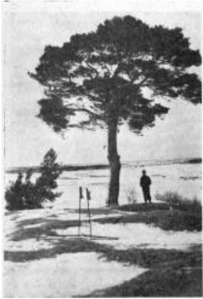
Ein Blick von der Napoleonskiefer bei Pr.-Eylau

Seite 6 Der letzte Schnee.