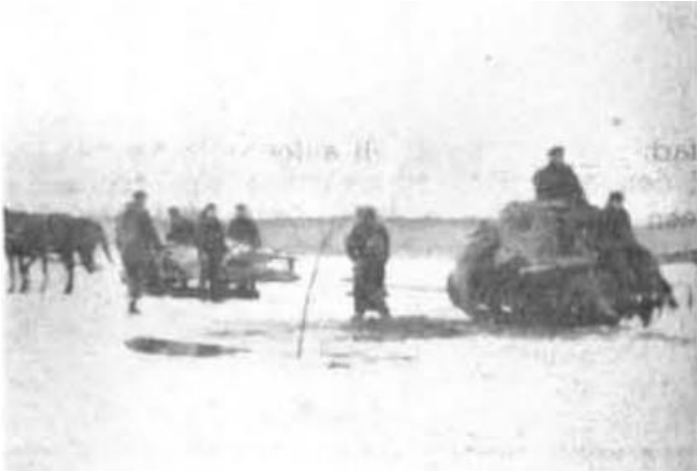
Ist der Zug gemacht, dann geht es auf Schlitten zur nächsten Stelle.