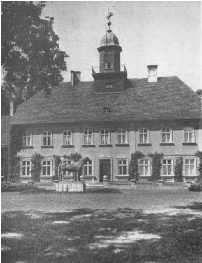
Das Schloss von Trakehnen Das Gebäude diente dem Landstallmeister als Amtssitz. Seine Gestalt erhielt es im Jahre 1819. Zu gleicher Zeit entstand auch die Alte Reitbahn, ein Feldsteinbau mit Rusfika und Halbrunden Fenstern. – Vor der Fassade des Schlosses steht das Denkmal des Hengstes „Tempelhüter“

Es ist hier nicht die Aufgabe, die Geschichte Trakehnens zu schreiben, erwähnt soll nur werden, dass es anfangs die Aufgabe des Hauptgestüts war, den Königlichen Marstall in Berlin mit entsprechenden Material an Reit- und Wagenpferden zu versorgen. Dieser Bestimmung wurde es erst später enthoben, als es aus dem Besitz der Hohenzollern in den des preußischen Staates überging, wo es die einzige Aufgabe hatte, Hengstmaterial für die preußischen Landgestüte zu züchten, welche die Väter der preußischen bzw. deutschen Remonten bilden sollten.