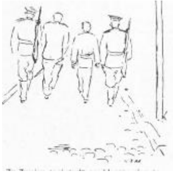
Zu Zweien aneinandergeschlossen ging es zum Bahnhof

So ging es von Station zu Station. Neue kamen hinzu andere stiegen aus. Am letzten Reisetag waren in der Box gegenüber Wieners drei Frauen; eine 84 Jahre alte Dame und ihre 25-jährige Enkelin , eine Musikstudentin, beide waren oft im Westen gewesen, um Verwandte zu besuchen. Beim letzten Grenzübergang waren sie festgenommen worden. Man fand Zeitschriften und Bücher bei ihnen. Wegen Spionage und Boykotthetze waren sie zu sechs und vier Jahren verurteilt worden. Die dritte, ein Taxi-Girl aus einem Westberliner Lokal, wollte ihre Tante besuchen und war als Agentin festgenommen worden. Die Tante ahnte nicht, dass ihre vor fünf Monaten verschwundene Nichte hatte zu ihr kommen wollen.