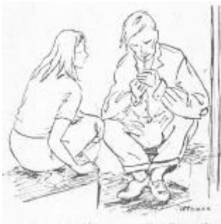
Eines der Mädchen verteilte Zigaretten

Zu zweien aneinandergeschlossen, brachte man die Gefangenen am 1. Dezember 1950 zum Bahnhof und in einen Transportwagen. Die Handschellen wurden abgenommen und sie zu je fünf in die kleinen Zwei-Mann-Boxen gepfercht. Die Reise von Magdeburg bis Luckau, 80 Kilometer südlich Berlins, währte drei Tage. Manchmal waren sie allein im Wagen. Mitunter war es so voll, dass selbst im Gang kaum Platz war, um dem Begleitpersonal ein Durchkommen zu ermöglichen. Ein buntes Menschengemisch, manche scheu und verlegen, andere laut und sehr betont. Menschen, die sich dauernd zwischen den Gesetzesmaschen bewegten und es als Spiel empfanden, dann und wann zu stolpern und erwischt zu werden, so wie auch dem besten Tormann Bälle ins Netz gehen.